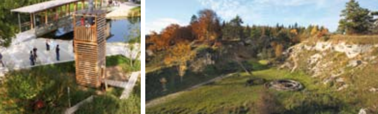
Der Brenzpark: Schauplatz der Landesgartenschau 2006