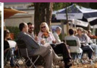
Der Biergarten im Brenzpark lädt zur Rast ein