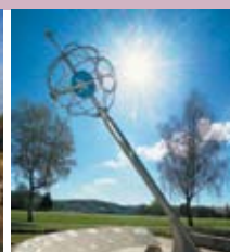
Sonnen- und Zeitpfad an der Brenz