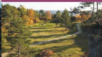
Wandern fernab vom Alltagsstress